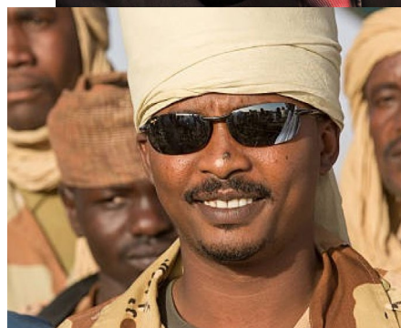
Mahamat IDRIS DÉBY (le fils)