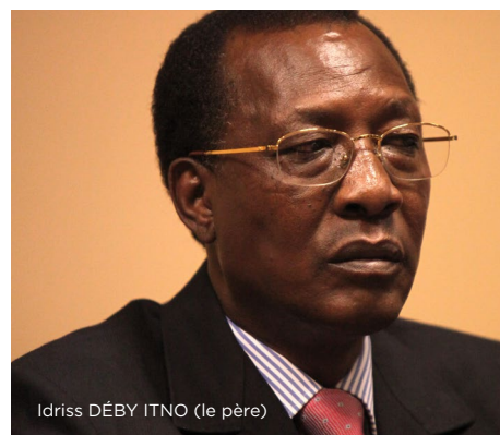
Idriss DÉBY ITNO (le père)

Le Tchad a ainsi ratifié toutes les conventions et les pactes majeurs en matière de droits humains dont la Déclaration Universelle des Droits de l'Homme (DUDH), le Pacte International relatif aux Droits Civils et Politiques (PIDCP), la Charte africaine des droits de l'homme et des peuples (Charte africaine) et a signé la Convention contre la torture et autres peines ou traitements cruels, inhumains ou dégradants (CAT).